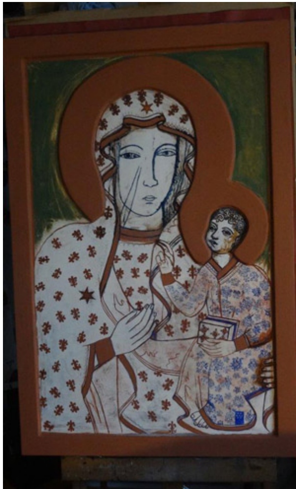
Początek pracy nad ikoną